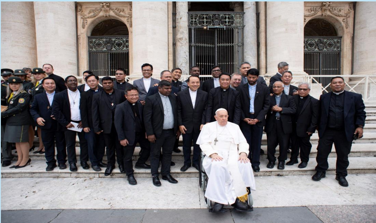
Padri Capitolari con Papa Francesco

Il Superiore Generale, poi, dichiara la chiusura ufficiale dell'VIII Capitolo Generale Ordinario della Congregazione Clericale dei Missionari della Fede.