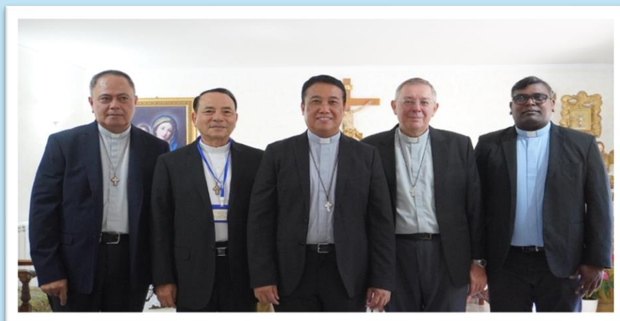
I Consiglieri Generali con il Padre Generale

Distinzione dal governo collegiale. Il consiglio consiglia, sia per consenso (voto deliberativo: formula imprecisa, il consiglio non delibera, ma esprime solo il suo consenso a ciò che il superiore propone) o per parere. Il consiglio non è un organo di governo con potere collegiale. Non è un'entità giuridica.