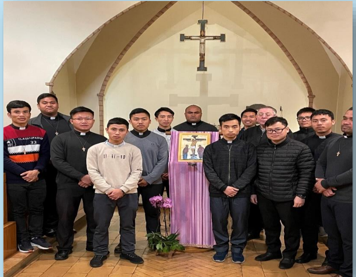
The MF Seminarians in Rome