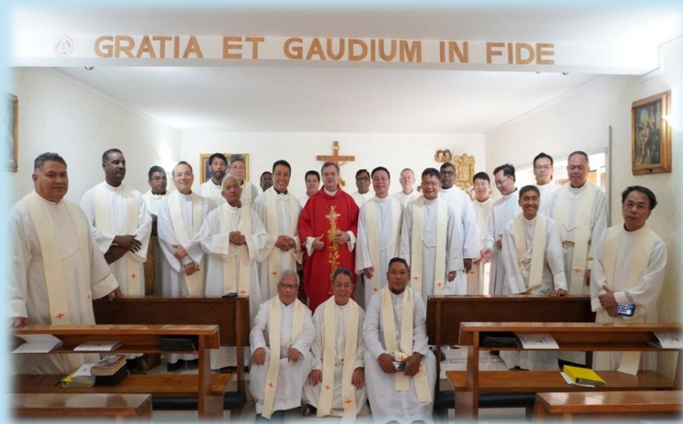
I Padri Capitolari con il Vicario per i Religiosi della diocesi di Roma

Scadenza Delle Mandati Dei Superiori Maggiori & Consiglieri: