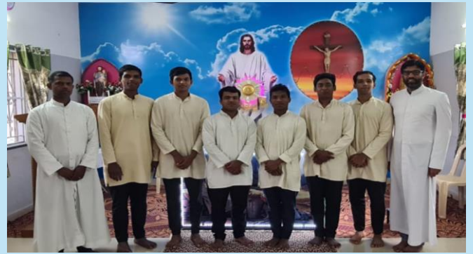
Fr Provincial Superior visit to the Novitiate Community