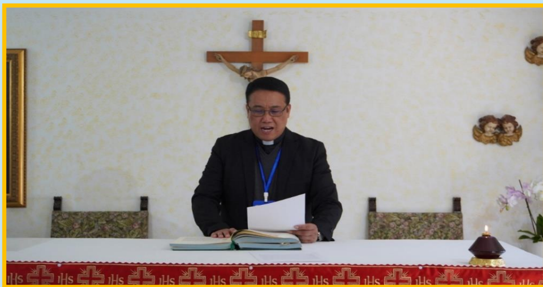
Momento di giuramento