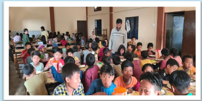
Provincial Superior to Longo Community